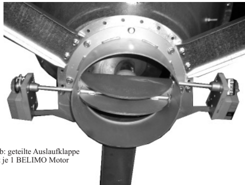
Abb: geteilte Auslaufklappe mit je 1 BELIMO Motor