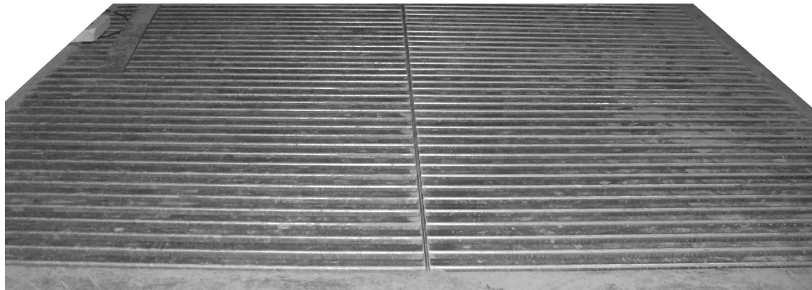
Abb: Grubenrost 2x1,50 m Deckbreite-